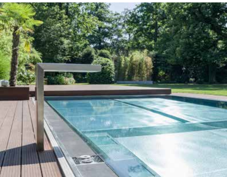
Edelstahl kommt auch bei den Wasserattraktionen zum Einsatz. Das Design der Schwalldusche geht auf eine Idee des Bauherrn zurück.

Der Flachwasserbereich kann als Relaxzone nach dem Schwimmen und als Spielplatz für die Kinder genutzt werden. Der Pool wird von einer Überlaufrinne eingefasst und verfügt über einen genoppten Boden. Dieser erzeugt je nach Lichteinfall interessante Spiegelungen im Wasser. Dazu ist das Schwimmbecken umfangreich mit Wasserattraktionen ausgestattet. Eine Viertelkreis-Ecktreppe führt hinein ins warme Wasser. Die Treppe läuft aus in eine Sprudelbank, in die Luftsprudel- und Massagedüsen integriert sind. >>